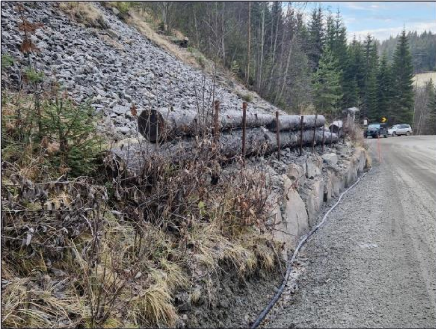
Figur 14. Dagens sikring av skråning