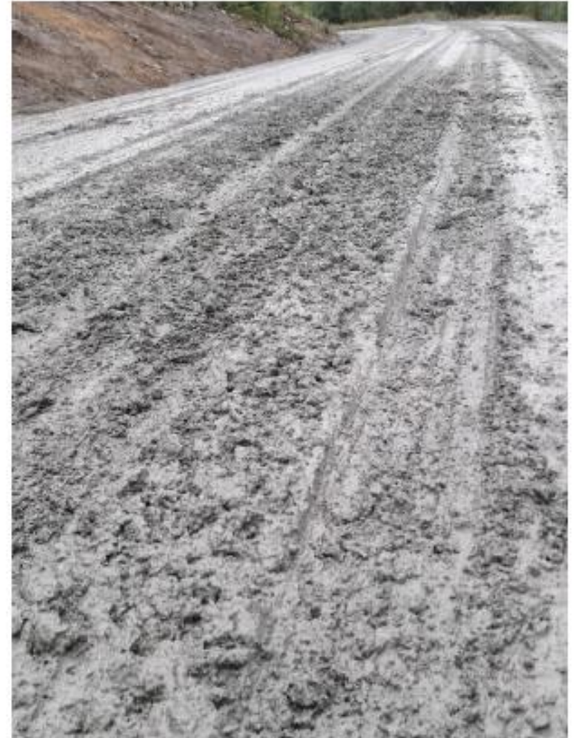
Figur 5. Ny-gruset veg i september 2022